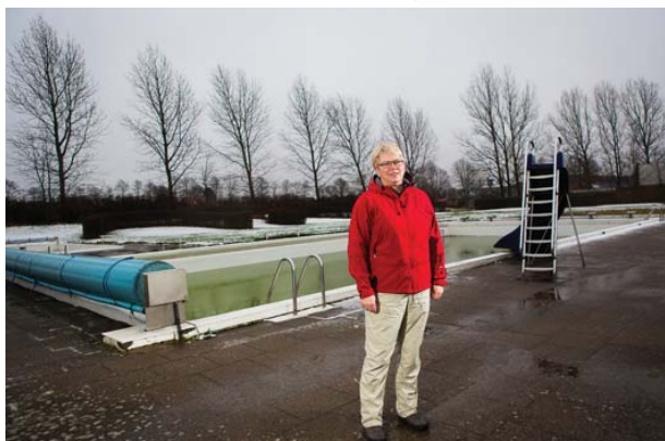
Bording Friluftsbad

Bording's Friluftsbad, som de seneste år har været lukningstruet, drives i dag udelukkende af frivillige. Krise og driftsbesparelser truede for alvor badet i 2011, men en massiv lokal opbakning, en underskriftsindsamling