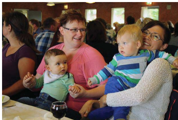
Foto fra fællesspisning

Trods det, at elitehåndbolden i 2007 flyttede fra Bording til Ikast, er idræts- og foreningskulturen stadig en stærk identitets- og fællesskabsmarkør i Bording, som går på tværs af generationerne. De frivillige i idrætsforeningerne, særligt i forbindelse med håndbold og fodbold, tæller både voksne og unge, hvor sidstnævnte træner de yngste rækker. Forældre og bedsteforældre støtter op som tilskuere til de mange kampe og deltager selv i foreningsaktiviteter som frivillige og aktive. Men også i foreningslivet er der begyndende tegn på tilbagegang. I flere af bestyrelserne er der mangel på udskiftning og for få yngre medlemmer. Borgere nævner, at foreningerne er præget af en "vi gør, som vi altid har gjort" kultur og ønsker, at foreningslivet skal satse på mere kreative, kulturelle tilbud i fremtiden.