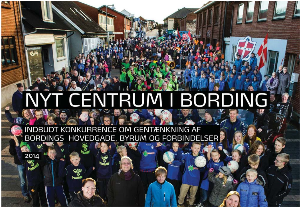
Arkitektkonkurrenceprogram Nyt centrum i Bording fra januar 2014