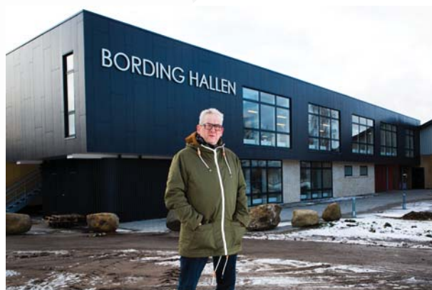
Foto fra Bording Hallen

Fritidsområdet i Bording ligger nordvest for bymidten med hallen som omdrejnings-