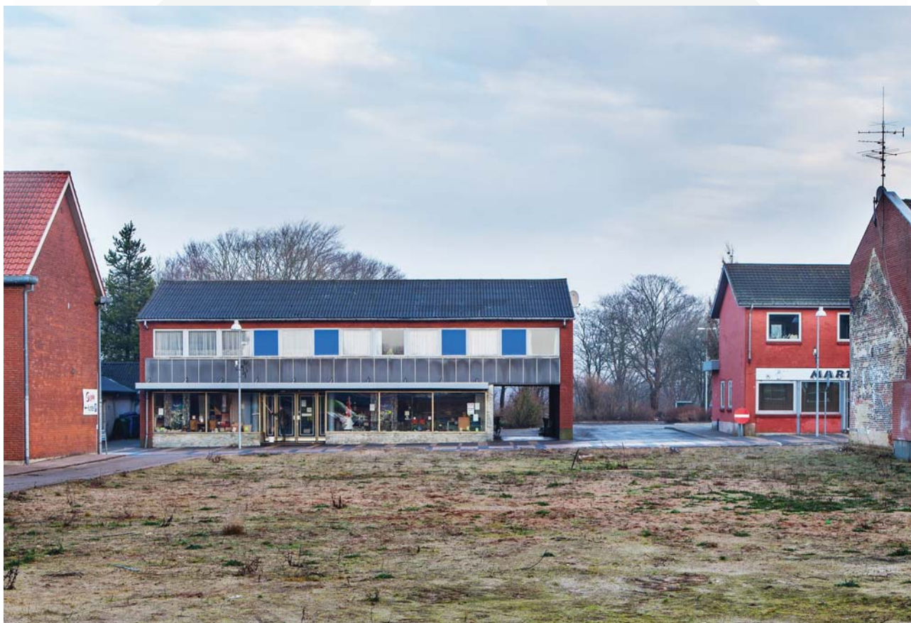
Foto af tidligere Imercobutik i Bredgade