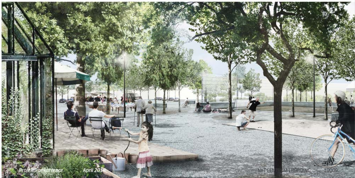
Vinderprojektet fra maj 2014 udarbejdet af Gottlieb Paludan Architects i samarbejde med landskabsarkitektfirmaet BOGL Bang & Linnét og Rådgivende Ingeniører MOE