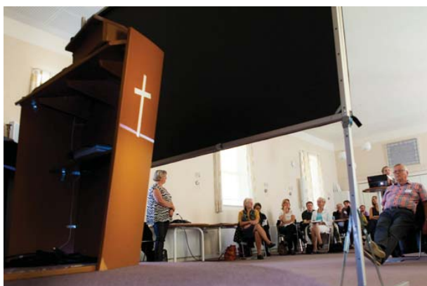
Foto fra missionshuset

På hande­lsgaden ligger Bordings Mis­sionshus, som bruges af det kristne miljø i Bording. Foruden missionshuset er kirken, som ligger et par kilometer nordvest for Bording i Bording Kirkeby, et relevant mødesteder for disse grupper.