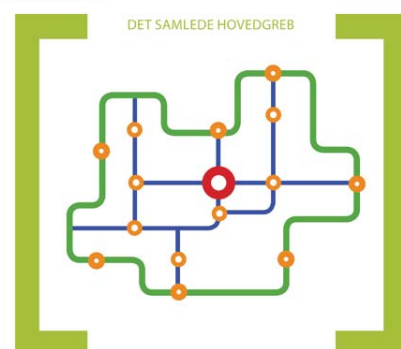
Illustration af det samlede hovedgreb i Bording Unite[d] fra idekatalog