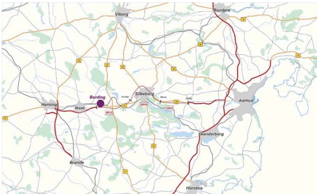
Illustration over regionale sammenhænge fra 2012

til de omkring liggende byer. Ikast ligger ca. en halv times kørsel fra Bording med bus, mens det tager omkring halvanden time at komme til Århus med tog.