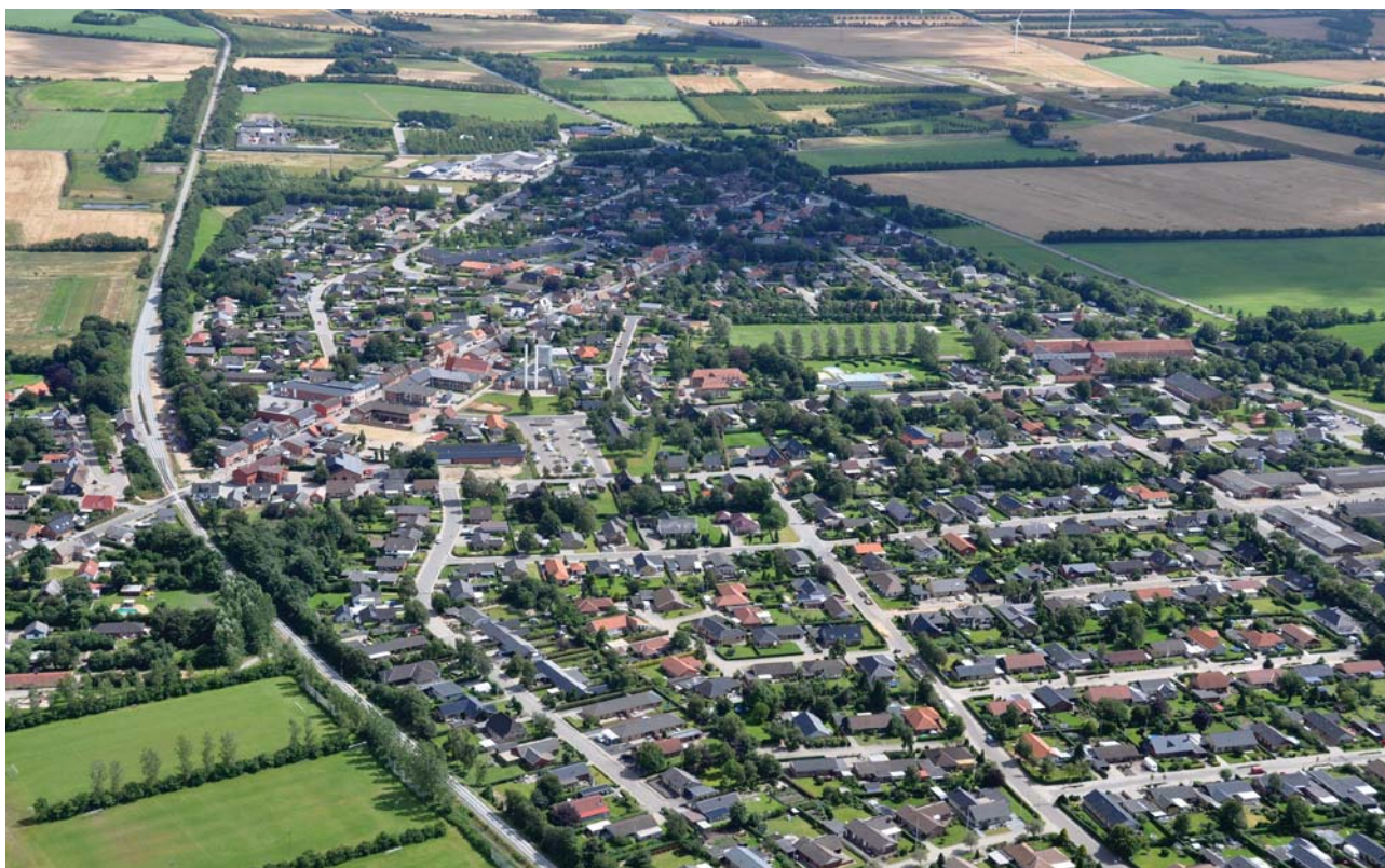
Luftfoto over Bording fra 2012