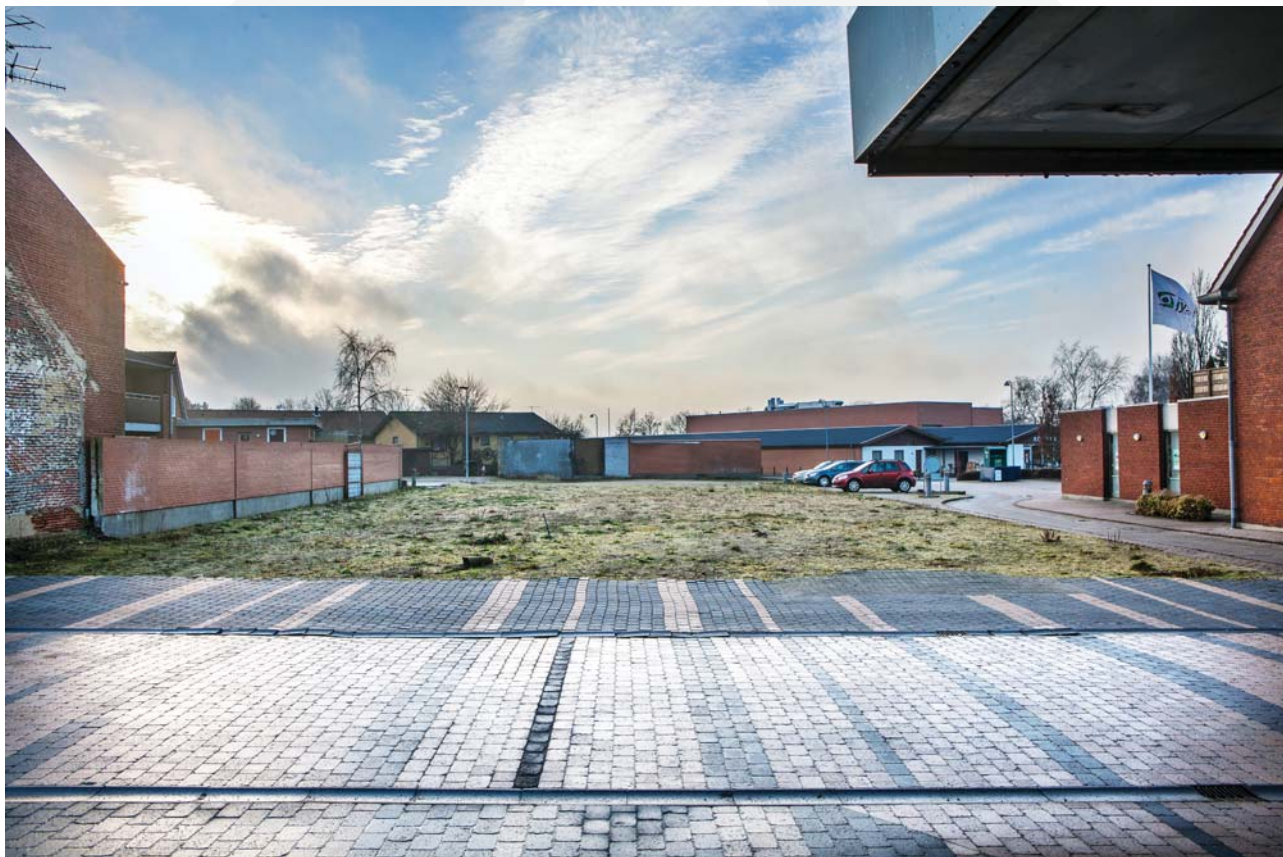
Foto fra Brandtomten i Bredgade

Seneste markante lukning i Bredgade kom i juli 2011, hvor SuperBest nedbrændte til grunden og dermed efterlod et markant tomrum i bymidten. Lukningen af SuperBest ses som et stort tab for borgerne og har medført, at mange nu handler i de omkringliggende byer tæt på deres arbejdsplads. En stor del af borgerne har således ikke længere deres daglige færden i hande ls gaden.