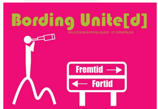
Visionsgruppens Idekatalog fra 2013

bejde med at udvikle Bording, idet kataloget både rummer den fælles vision og bidrager til at skabe overblik over de enkelte projekter, deres bagvedliggende værdisæt, og hvordan projekterne skaber fysiske og sociale forbindelser i byen. Det er Ikast-Brande Kommunes ønske at Bording Unite[d] skal have en demonstrationsværdi for andre mindre stationsbyer, som i lighed med Bording ønsker at ændre selvforståelse eller videreudvikle en attraktiv byprofil. Kataloget skal give lokale og eksterne interessenter et indblik i byens planer og projekter, og ikke mindst den helhed, de enkelte projekter indgår i. Kataloget kan også indgå i en generel diskussion om mindre stationsbyer og deres fremtidige rolle i Danmark.