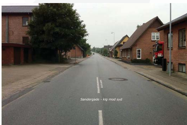
Foto fra Søndergade

Bording og byens bløde trafikanter er således udfordret af, at Klochsvej og Søndergade både udgør meget benyttede regionale gennemfartsveje og vigtige lokale forbindelser for skole, hjem og fritidsaktiviteter.