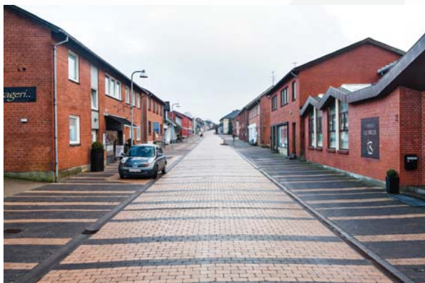
Foto fra Bredgade

sydlige del primært anvendes til beboelse. Udover Bredgade rummer bymidten to pladسدannelser, Jens Christensens Plads og Smørhullet. Begge fungerer i dag som parkeringspladser. Smørhullet, som er opkaldt efter det nu nedlagte mejeri, var tidligere byens festplads og har derfor givet navn til Bordings årlige byfest, Smørhulsfesten. Med de seneste års butikslukninger har Bredgade gradvist mistet sin puls og giver i dag indtryk af en halvtom bykerne med få arkitektoniske kvaliteter. Bredgade opleves og fungerer stadig som byens hovedgade.