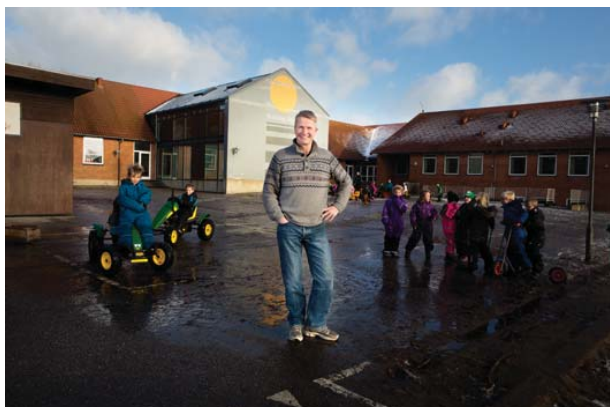
Foto fra skolen

Digitalt Foto samt Skind og Læder, mens Ikast supplerer med Opfinderværksted, Skuespillertræning, Showdance og Konditorkunst. Der efterspørges muligheder for et samlingssted for byen unge i alderen 14-18 år.